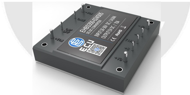
图2：产品外观示意图